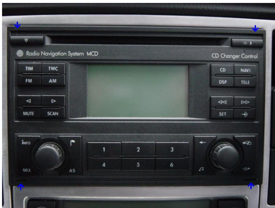
Die Pfeile markieren die 4 Entriegelungsöffnungen.