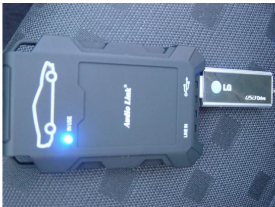
Audio-Link im Funktionstest