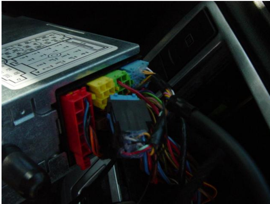
Fertig zusammengesteckt (Audio-Link durchgeschleift).