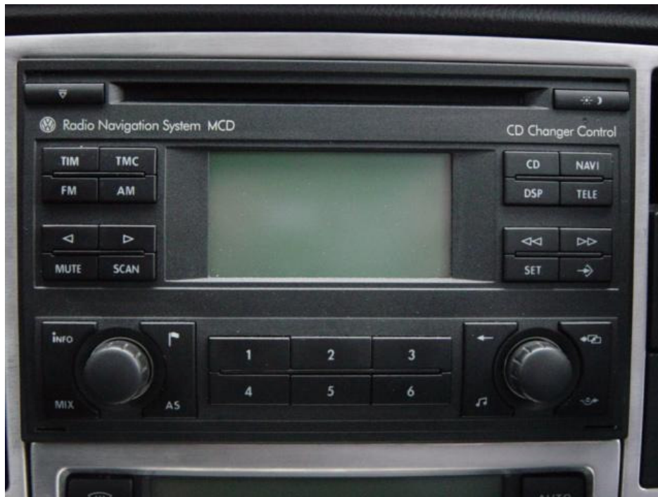
Radio MCD im VW Passat 3BG (Bj.2000-2005).