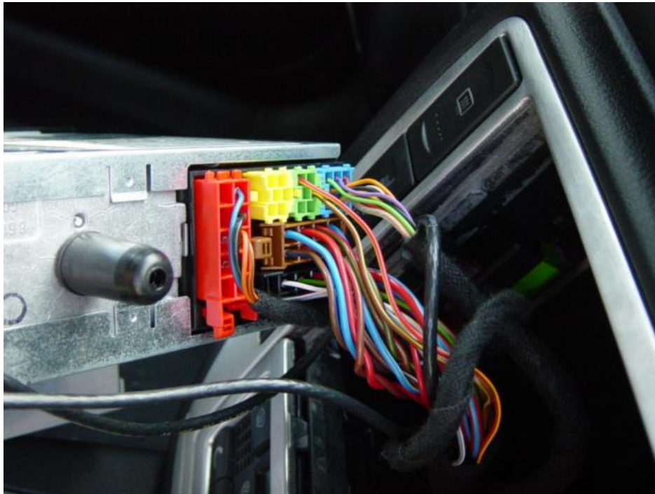
Ansicht der Stecker auf der Radiorückseite.