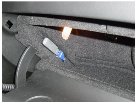
Fertig eingebaut (da im Handschuhfach wenig Platz ist, wurde der Audio-Link unterm Armaturenbrett montiert und ein USB-Kabel verlegt)